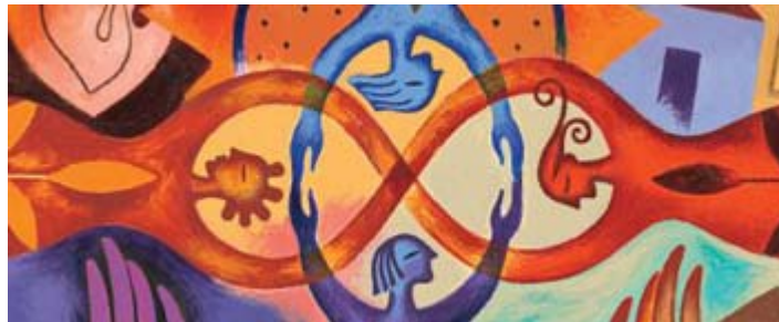
Les femmes, une force du syndicat